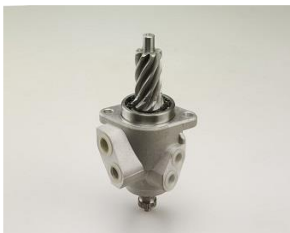
شیر هیدرولیک هزار خاری MIDJET 405

شیر هیدرولیک هزار خاری MIDJET 405 شرکت تولیدی پشتیبانی صنایع طه