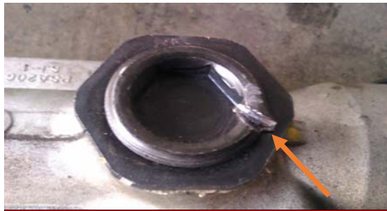
نمونه غیر قابل قبول

۷- آثار هر گونه ضربه خوردگی بر روی درپوش یوک و از تنظیم خارج شدن درپوش یوک