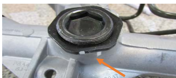
نمونه غیر قابل قبول

۳- از تنظیم خارج شدن درپوش یوک ( باز شدن در پوش) و هم راست نبودن مارکر درپوش