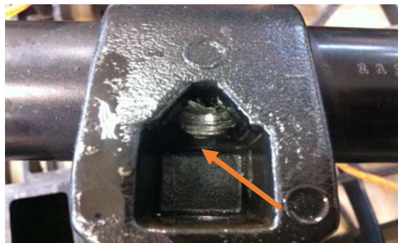
نمونه غیر قابل قبول

۴- استفاده از پیچ غیر استاندارد که برای نصب فرمان به رام استفاده می گردد و باعث برخورد پیچ رام به پایه جعبه فرمان و ایجاد صدا می گردد