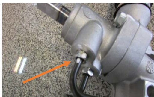
نمونه غیر قابل قبول

۲- باز شدن لوله های هیدرولیک و از ترک خارج شدن مهره های اتصال به شیر و جک