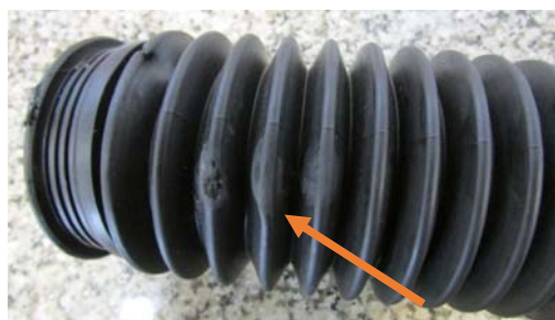
نمونه غیر قابل قبول