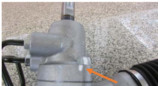
نمونه غیر قابل قبول

۱- باز شدن شیر فرمان و از ترک خارج شدن پیچهای اتصال شیر به پوسته