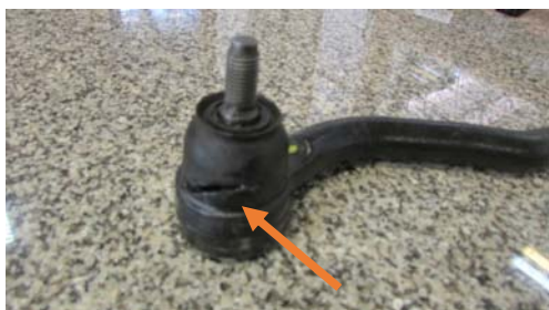
نمونه غیر قابل قبول